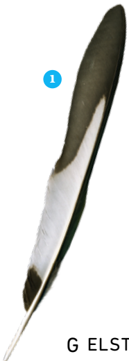
G ELSTER Länge: 44 bis 46 cm Flügelspannweite: 52 bis 60 cm Lebensraum: halboffene Landschaft, Siedlungen, Parks