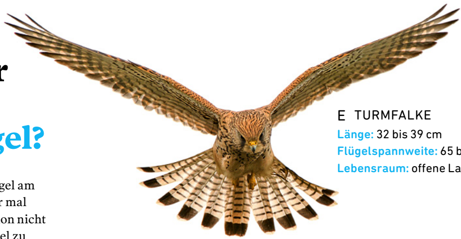
E TURMFALKE Länge: 32 bis 39 cm Flügelspannweite: 65 bis 82 cm Lebensraum: offene Landschaft

An ihrem Federkleid können wir Vögel am leichtesten erkennen. Wenn wir aber mal eine einzelne Feder finden, ist es schon nicht mehr so leicht, den zugehörigen Vogel zu bestimmen. Manchmal hilft eine typische Farbe oder ein besonderes Muster... Findet Ihr gemeinsam heraus, welcher Vogel zu welcher Feder passt? Zu jeder Zahl gehört ein Buchstabe, in der richtigen Reihenfolge ergeben sie das Lösungswort.