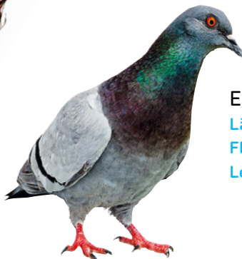
E STADTTAUBE Länge: 31 bis 34 cm Flügelspannweite: ca. 68 cm Lebensraum: Städte