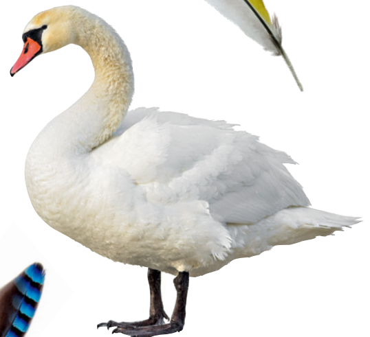
F HÖCKERSCHWAN Länge: 125 bis 160 cm Flügelspannweite: 208 bis 240 cm Lebensraum: Seen, Flüsse