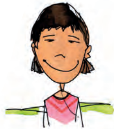
5 MONGOLEN Heimat: Mongolei, Asien Lebensweise: Viehzucht, Wollproduktion