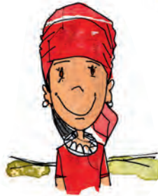
2 BEDUINEN Heimat: Sinai/ Arabische Halbinsel, Asien Lebensweise: Viehzucht