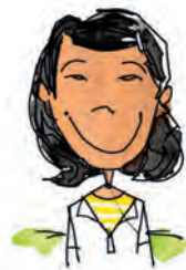
6 BANAR Heimat: Vietnam, Asien Lebensweise: Reisanbau, Jagd