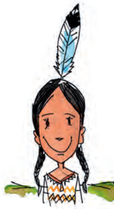
1 SIOUX Heimat: Prärie, Nordamerika Lebensweise: Bison-Jagd, Ackerbau

Ob in Afrika, Asien oder Europa: Menschen leben heute überall auf der Welt in Häusern, die sich vor allem in den großen Städten äußerlich kaum noch unterscheiden. Früher war die traditionelle Bauweise viel stärker an die natürlichen Gegebenheiten angepasst und somit von Land zu Land verschieden. Besonders die nomadisch lebenden Völker, die von Ort zu Ort zogen, mussten für ihre vorübergehenden Behausungen mit dem Baumaterial zurechtkommen, das sie an Ort und Stelle fanden. Wisst Ihr, wie ihre typischen Behausungen aussehen?