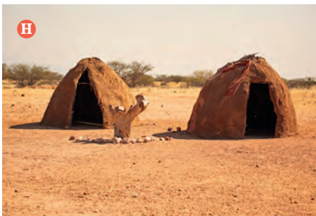
Die Lehmhütte besteht meist aus Ästen und Palmblättern, verputzt mit Dung und Lehm.