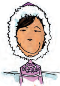
4 INUIT Heimat: Arktis, Nordamerika Lebensweise: Jagd, Fischfang