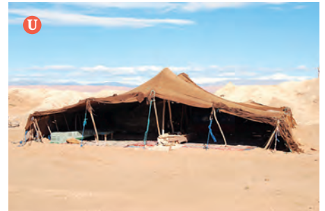
Das Wüstenzelt besteht aus Stoff, der auf Holzpfosten gespannt wird, um vor Sonne und Wind zu schützen. Der Boden wird manchmal mit Teppichen ausgelegt.