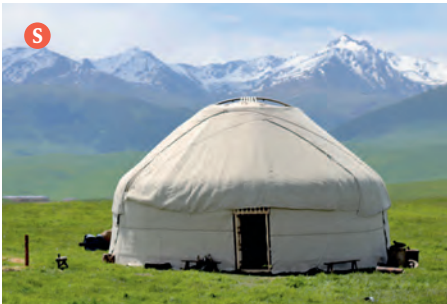
Die Wände der Jurte bestehen aus Holzgittern, auf die Baumwolltücher und Filzmatten gebunden werden.