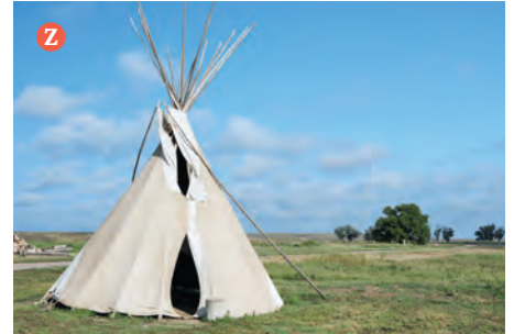
Das Tipi ist ein Zelt aus kegelförmig aufgestellten Stangen, über die zusammengenähte Büffelhäute gespannt werden.