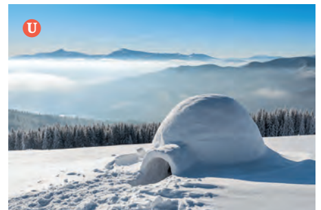
Für das Iglu werden Blöcke aus fest gefrorenem Schnee herausgeschnitten und spiralförmig zu einem Kuppelbau aufgeschichtet.