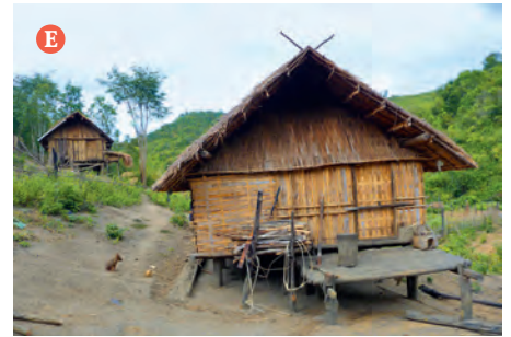
Die Bambushütte wird oft auf Stelzen gebaut, weil der Boden bei starken Regenfällen sumpfig wird.